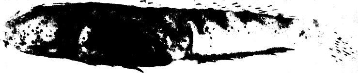
Fig. 1. Cryptocentroides insignis (Seale), specimen (LICPP 1968304, 47 mm in standard length) from Ishigakijima, Okinawa Pref.

頭部から尾部前部にかけて濃暗色点散在する。背鰭前方に 2 薄暗色横帯がある。第 2 背鰭下の体側に数列の薄暗色斜線, 尾柄部に 2 暗色横帯がある。第 1